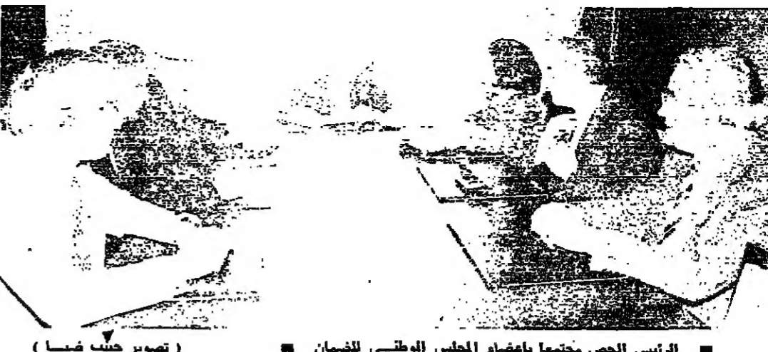
الرئيس الحصن يجتمع بأعضاء المجلس الوطني للضمان

وكرر رئيس الحكومة نشاطه على معالجة المواضيع التموينية والاقتصادية ، وفي مقدمتها قضية الغلاء . وقد استقبل الرئيس الحصن عند الساعة الثانية عشرة اعضاء المجلس الوطني للضمان وجرى البحث في قضايا الضمان بصفة كون الحصن رئيسا للمجلس الوطني بحكم القانون . وقد قسم الاجتماع مدير عام الاقتصاد السيد - طهوان موصلي ، وزير الزراعة السيد طهوان موصلي ووزير مصلحة حياة المستهلك السيد مبرياري . وقد تقرر في الاجتماع تقديم سمرة جديدة للادوية الى وزير الصحة ليصار الى تطبيقها .